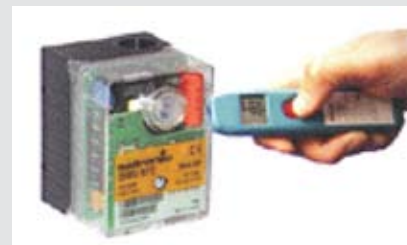
Détection d'erreur grâce à la fréquence de clignotement

Testo va encore un peu plus loin avec l'analyseur de gaz de fumée type 330. Celui-ci est raccordé via une interface de câble au relais de brûleur et affiche visuellement l'état actuel du brûleur et