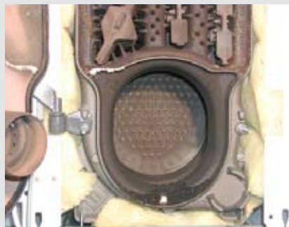
Mazout extra (50 ppm)