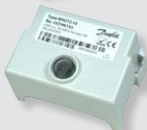
Relais électronique de brûleur

Dans ces versions électroniques, toutes les étapes sont commandées électroniquement par des microprocesseurs. Le module EEPROM tient à jour un historique du fonctionnement du brûleur. Outre les principales marques OEM (Satronic, Honeywell, Siemens et Danfoss), des fabricants de brûleurs proposent leur propre produit, en collaboration ou non avec les marques précitées.