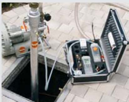
Mesure de différence de pression pendant le test d'étanchéité

Avant tout, précisons qu'un test d'étanchéité ne doit pas uniquement être effectué sur le réservoir, il concerne "l'installation de stockage". Ceci implique donc également les conduites telles que celle de remplissage, celles vers le brûleur, etc. Il existe deux principes pour le contrôle d'étanchéité sur des réservoirs enfouis. Le premier test se fait au moyen d'une mesure de différence de pression . En l'occurrence, on place le réservoir en dépression ou surpression pour constater s'il est étanche ou non. Un deuxième principe est la mesure par ultrasons . Après avoir placé 2 capteurs dans le réservoir (un dans le liquide et un autre au-dessus du niveau du liquide) et mis ensuite celui-ci en dépression, on peut évaluer l'étanchéité sur la base d'ultrasons. Ces deux principes ont leurs propres spécificités.