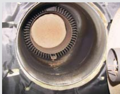
Teneur en S: 43 ppm