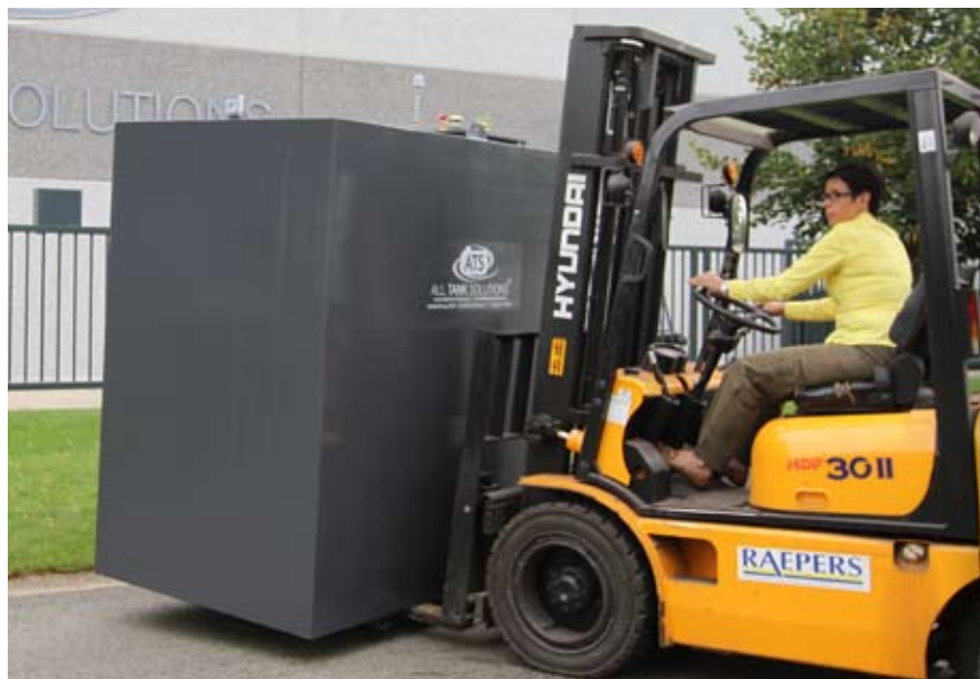
Illustrations sur cette page: ATS – All Tank Solutions, Zonhoven (photo Fasseur)