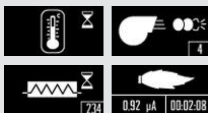
L'affichage de l'état du brûleur, Elcogramm

Conclusion: un relais électronique de brûleur simplifie donc le travail de dépistage du technicien, à condition que ce dernier soit bien documenté et que l'installation ait correctement été raccordée sur le plan électrique.