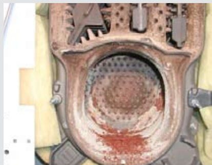
Mazout (1000 ppm)

L'entretien et le nettoyage de la chaudière augmentent sa durée de vie et maintiennent ses performances à un niveau optimal. Certains produits nettoient la chaudière en état de marche. La suie et les résidants de combustion incomplète sont neutralisés par oxydation, même à des endroits qui sont inaccessibles au nettoyage manuel.